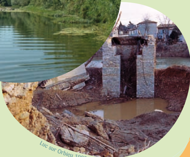
Luc sur Orbieu 1999